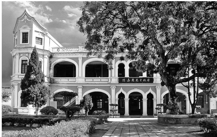
陈嘉庚先生故居

本报讯 今年10月21日是陈嘉庚先生诞辰150周年。10月15日,《厦门市嘉庚教育遗产保护办法》新闻发布会举办,现场公布《厦门市嘉庚教育遗产保护办法》(以下简称“《办法》”),将于2024年10月21日起施行。《办法》将每年的10月21日确定为“嘉庚教育遗产日”。