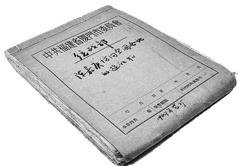
陈嘉庚访问全国各地的游记稿。