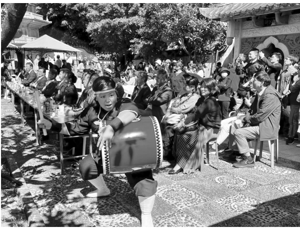
▲冲绳那霸市福州园内的冲绳太鼓表演。(资料图)

谢必震:琉球国位于中国台湾岛与日本九州之间,即今日冲绳地区。据传,琉球国自“天孙氏”开始,传至25代。琉球国舜天王之后为英祖王时代(1260年至1349年),1350年起进入察度王时代。1372年,明太祖朱元璋诏谕四海,中国与琉球国建立宗藩关系。清承明制,中琉友好交往500多年,直到1879年琉球国为日本所吞并。