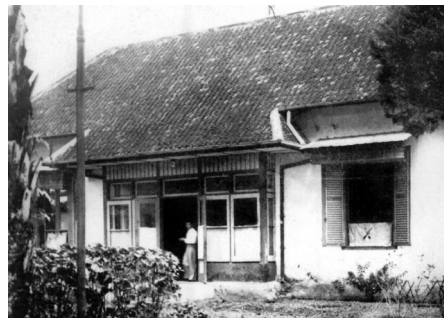
▲陈嘉庚避难期间居住过的印尼玛琅巴兰街4号

今年是陈嘉庚先生诞辰150周年,福建省委统战部、福建侨报社共同开设“旗帜与光辉”专栏,传承弘扬嘉庚精神,讲述华侨故事,展示新时代福建侨务工作,敬请关注!