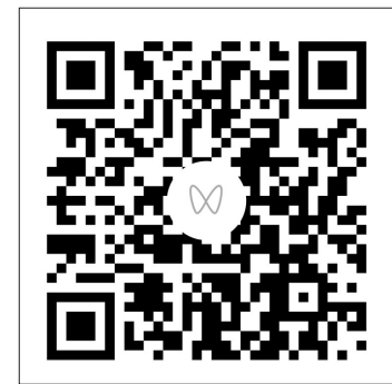
扫一扫，观看《诗画芒种》