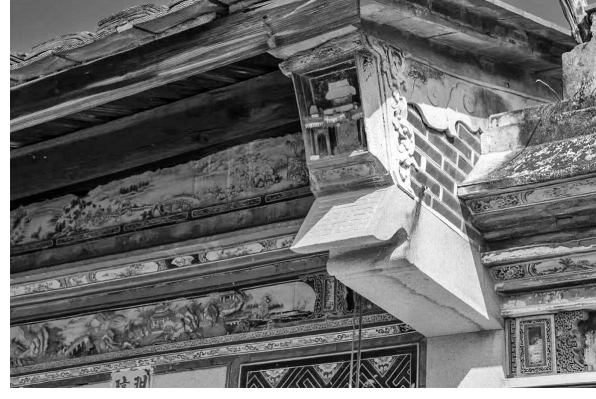
在大夫第,随处可见的木雕、石雕、砖雕,精致程度无不令人击节赞叹。(蔡明辉 胡智勤 供图)