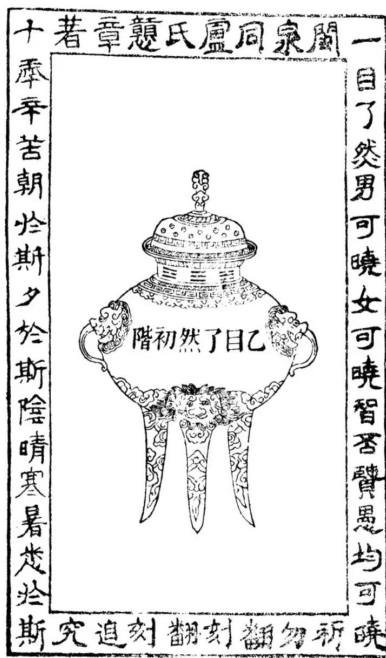
▲ 《一目了然初阶》插图