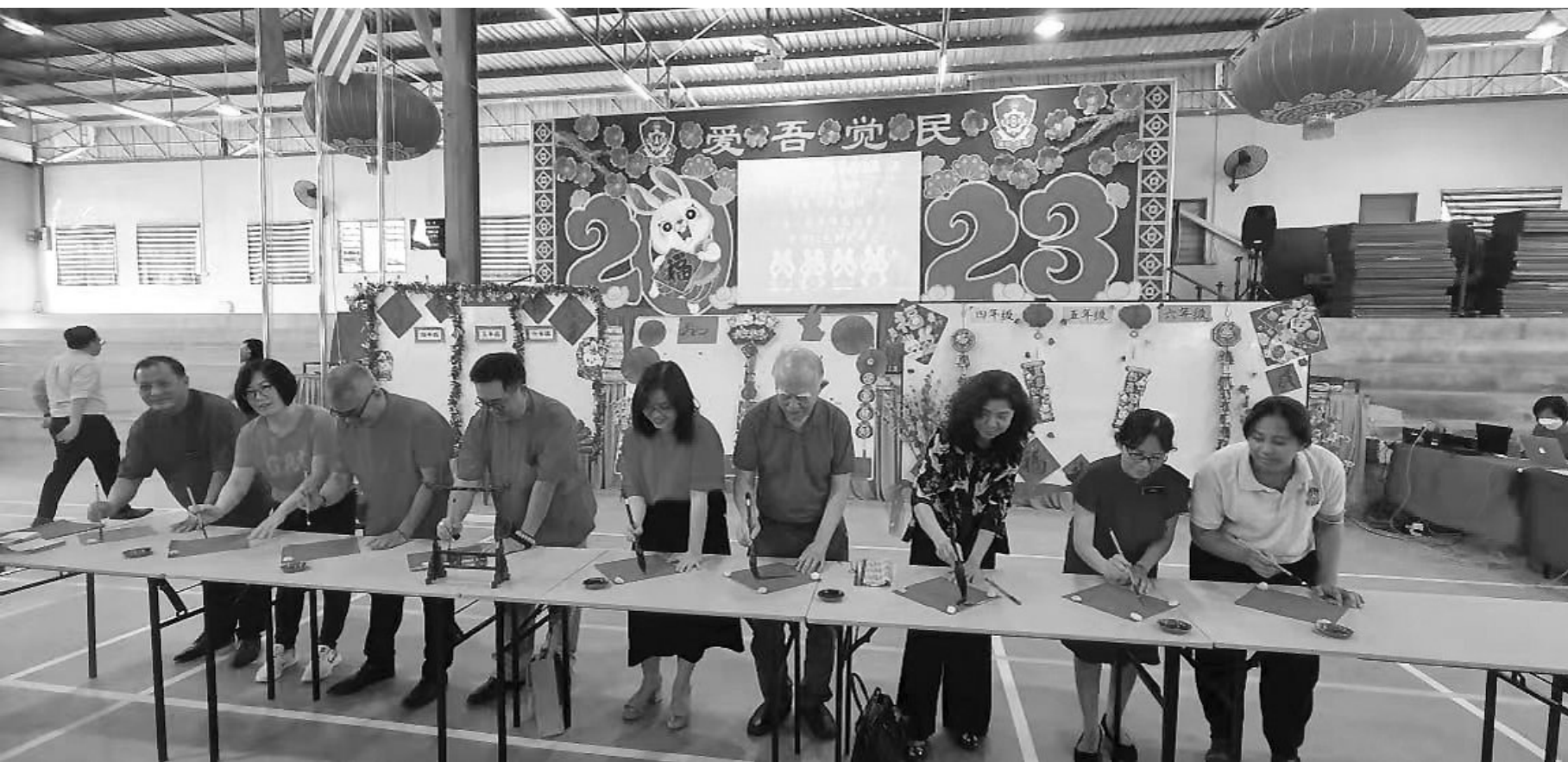
△ 作者全家在马来西亚吉打州觉民小学挥春比赛中开笔。

(菲尔 作者为马来西亚华人、福建师范大学文学博士,2021年3月获槟城州政府颁发的“热诚贡献奖章”。)