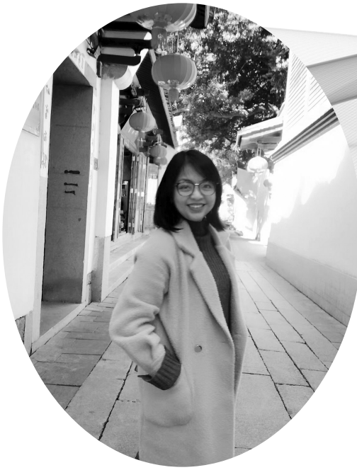
△ 作者在福建师范大学求学期间于三坊七巷留影。

小时候,每逢农历新年,学校的老师都会给我们讲述与“福”有关的知识。让我印象最深刻的,就是把“福”写在红纸上倒挂,寓意“福到了”。那时,我心中对老师充满崇拜,怎么那么有学问啊!长大后才知道,原来“福到了”这一说法,遍及世界各地的华社。